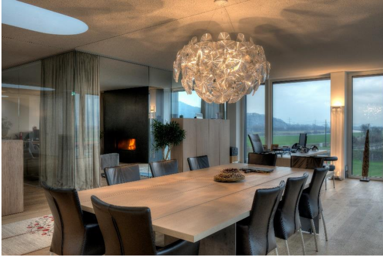
Büroteil 1 Süden / Westen